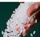
高密度ポリエチレン (HDPE)