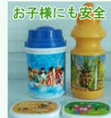
お子様用の製品にも使われているので、とっても安全です。