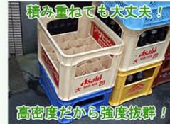
強度があるので、積み重ねても大丈夫です。耐候性も抜群です！