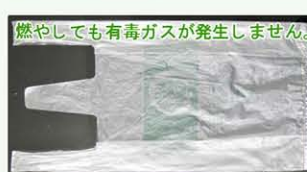
焼却しても有毒なガスは発生しません。