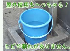
耐久性、耐候性に優れているので、屋外でもよく使われます。

焼却した場合にも、ダイオキシンが発生しません。「Eee-Wood」は、エコ製品です。100%安心してご使用ください。